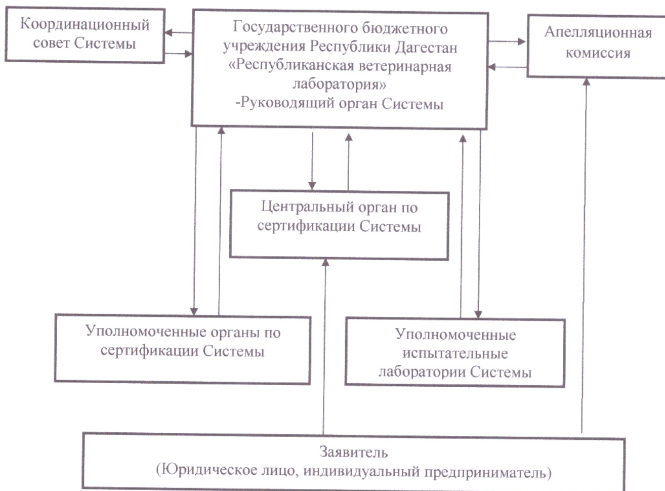
СХЕМА организационной структуры Системы добровольной сертификации «Дагестанский продукт»